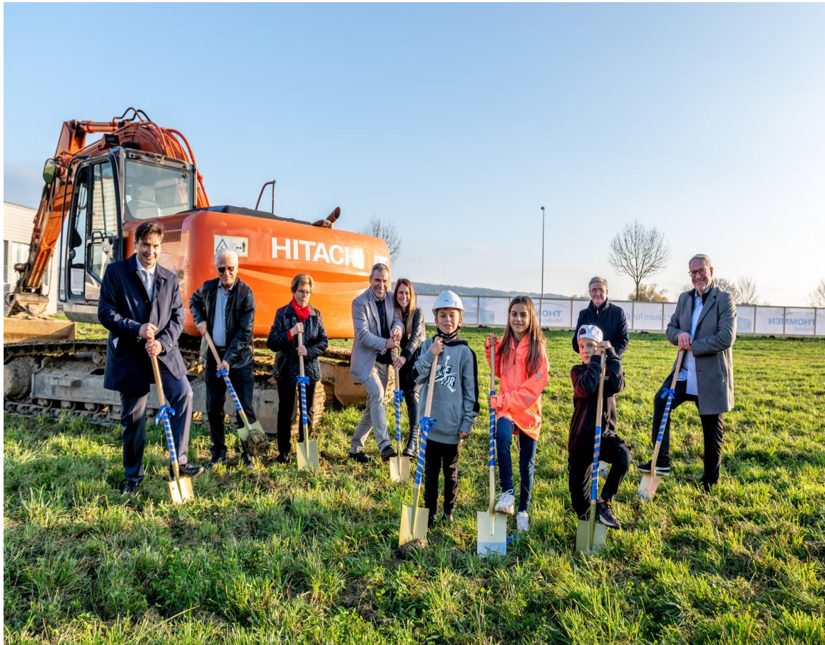
Spatenstich zum Neubau von Thommen Medical, Grenchen